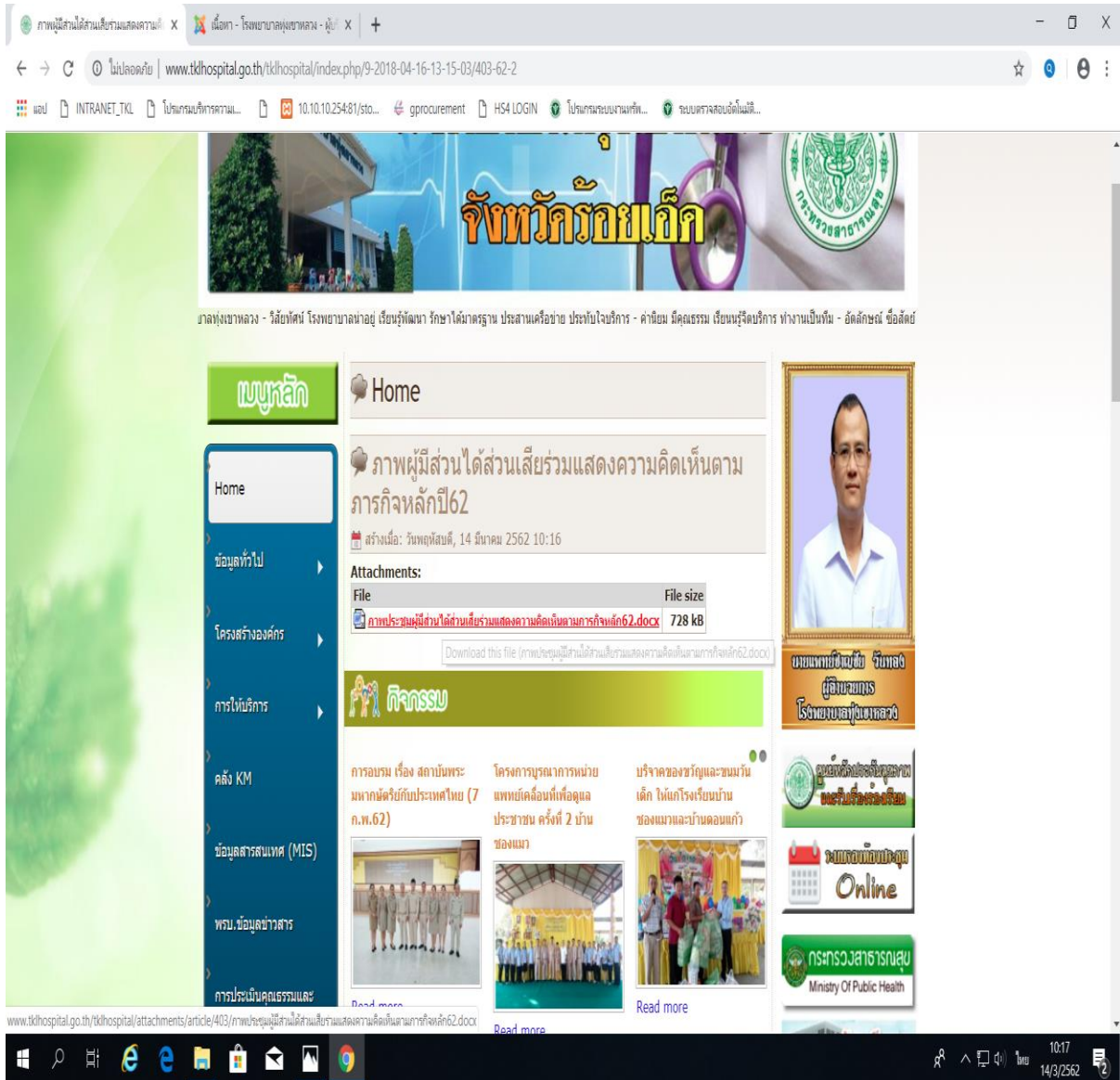
Print screen ผู้มีส่วนได้ส่วนเสียร่วมแสดงความคิดเห็นตามภารกิจหลัก ปี ๒๕๖๒